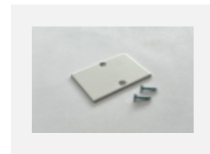
145-50101, W 2xkoncovka - kov, šroubová