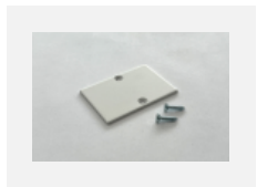
145-50101, B 2xkoncovka - kov, šroubová