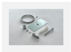
145-50303, N lankový závěs na spoj 2000mm-1 ks + kovový úchyt