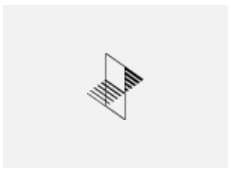
145-01200, F příslušenství k demontáži el. modulu z profilu Liny145