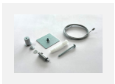
145-50302, N lankový závěs 6000mm-1 ks + kovový úchyt