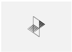
145-20700, B 2 ks úchytu na stěnu Lina45