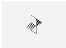
145-01200, F příslušenství k demontáži k profilu Liny145