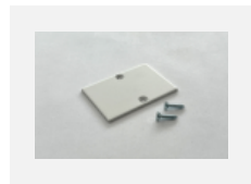
145-50101, W 2xkoncovka - kov, šroubová