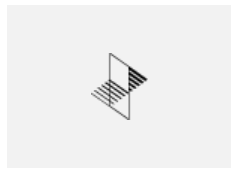
145-20700, W 2 ks úchytu na stěnu Lina45