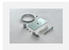
145-50303, N lankový závěs na spoj 2000mm-1 ks + kovový úchyt