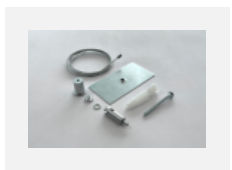
145-50305, N lankový závěs na spoj 6000mm-1 ks + kovový úchyt