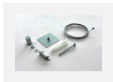
145-50302, N lankový závěs 6000mm-1 ks + kovový úchyt