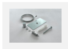
145-50304, N lankový závěs na spoj 4000mm-1 ks + kovový úchyt