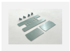
145-50200, F spoj přímý a krytky průsvitu