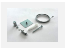
145-50300, N lankový závěs 2000mm-1 ks + kovový úchyt