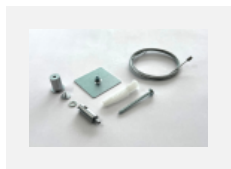
145-50301, N lankový závěs 4000mm-1 ks + kovový úchyt