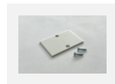
145-50101, S 2xkoncovka - kov, šroubová