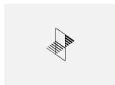
145-20700, S 2 ks úchytu na stěnu Lina45