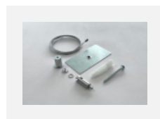
145-50303, N lankový závěs na spoj 2000mm-1 ks + kovový úchyt