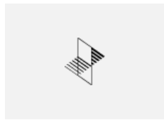
145-20700, B 2 ks úchytu na stěnu Lina45