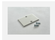
145-50101, B 2xkoncovka - kov, šroubová