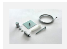
145-50301, N lankový závěs 4000mm-1 ks + kovový úchyt