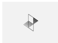
145-01200, F příslušenství k demontáži el. modulu z profilu Liny145