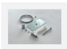
145-50305, N lankový závěs na spoj 6000mm-1 ks + kovový úchyt