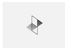
145-20700, S 2 ks úchytu na stěnu Lina45