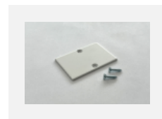
145-50101, S 2xkoncovka - kov, šroubová