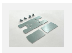
145-50200, F spoj přímý a krytky průsvitu