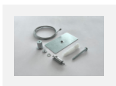
145-50305, N lankový závěs na spoj 6000mm-1 ks + kovový úchyt