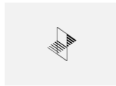
145-20700, B 2 ks úchytu na stěnu Lina45