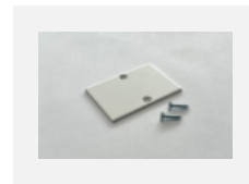
145-50101, B 2xkoncovka - kov, šroubová