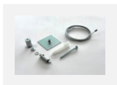
145-50301, N lankový závěs 4000mm-1 ks + kovový úchyt