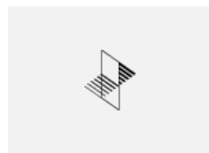
145-20700, B 2 ks úchytu na stěnu Lina45