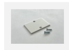
145-50101, B 2xkoncovka - kov, šroubová