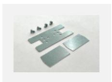
145-50200, F spoj přímý a krytky průsvitu