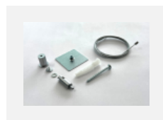
145-50302, N lankový závěs 6000mm-1 ks + kovový úchyt