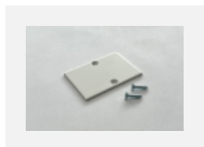
145-50101, S 2xkoncovka - kov, šroubová