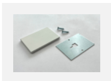
145-50102, W 2xkoncovka - kov, bezšroubová