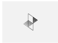
145-20700, W 2 ks úchytu na stěnu Lina45