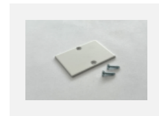
145-50101, W 2xkoncovka - kov, šroubová