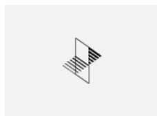
145-20700, B 2 ks úchytu na stěnu Lina45