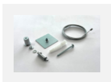
145-50300, N lankový závěs 2000mm-1 ks + kovový úchyt