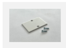
145-50101, B 2xkoncovka - kov, šroubová