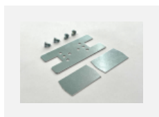
145-50200, F spoj přímý a krytky průsvitu