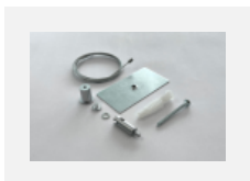
145-50304, N lankový závěs na spoj 4000mm-1 ks + kovový úchyt