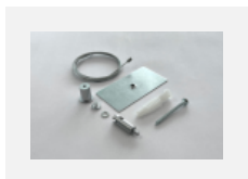
145-50303, N lankový závěs na spoj 2000mm-1 ks + kovový úchyt