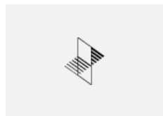
145-20700, W 2 ks úchytu na stěnu Lina45