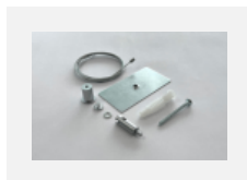
145-50305, N lankový závěs na spoj 6000mm-1 ks + kovový úchyt