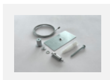
145-50305, N lankový závěs na spoj 6000mm-1 ks + kovový úchyt