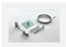
145-50302, N lankový závěs 6000mm-1 ks + kovový úchyt