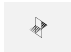
145-01200, F příslušenství k demontáži el. modulu z profilu Liny145