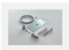
145-50304, N lankový závěs na spoj 4000mm-1 ks + kovový úchyt