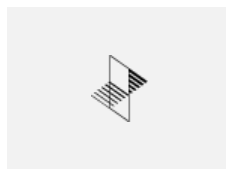
145-20700, W 2 ks úchytu na stěnu Lina45