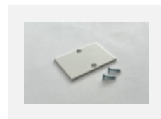
145-50101, W 2xkoncovka - kov, šroubová