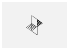
145-20700, B 2 ks úchytů na stěnu Lina45