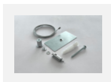
145-50305, N lankový závěs na spoj 6000mm-1 ks + kovový úchyt