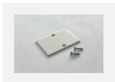
145-50101, B 2xkoncovka - kov, šroubová