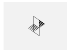
145-01200, F příslušenství k demontáži el. modulu z profilu Liny145