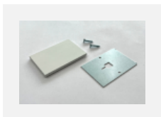
145-50102, B 2xkoncovka - kov, bezšroubová