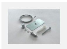
145-50303, N lankový závěs na spoj 2000mm-1 ks + kovový úchyt