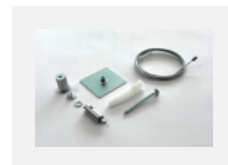
145-50301, N lankový závěs 4000mm-1 ks + kovový úchyt