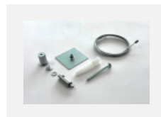
145-50300, N lankový závěs 2000mm-1 ks + kovový úchyt