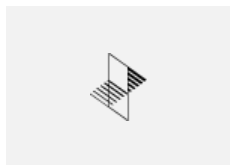
145-20700, S 2 ks úchytů na stěnu Lina45