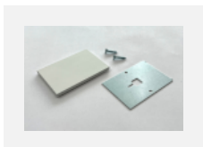
145-50102, S 2xkoncovka - kov, bezšroubová