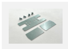
145-50200, F spoj přímý a krytky průsvitu