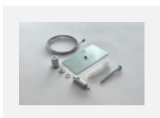
145-50304, N lankový závěs na spoj 4000mm-1 ks + kovový úchyt