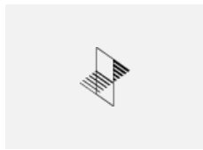
145-01200, F příslušenství k demontáži el. modulu z profilu Liny145