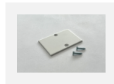
145-50101, B 2xkoncovka - kov, šroubová