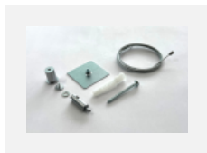
145-50301, N lankový závěs 4000mm-1 ks + kovový úchyt