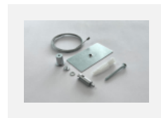
145-50303, N lankový závěs na spoj 2000mm-1 ks + kovový úchyt