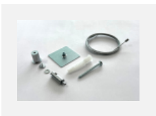
145-50300, N lankový závěs 2000mm-1 ks + kovový úchyt