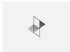
145-20700, B 2 ks úchytu na stěnu Lina45