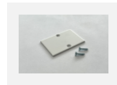
145-50101, S 2xkoncovka - kov, šroubová