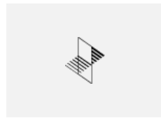
145-20700, S 2 ks úchytu na stěnu Lina45