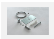
145-50303, N lankový závěs na spoj 2000mm-1 ks + kovový úchyt