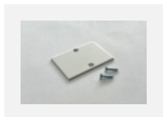
145-50101, B 2xkoncovka - kov, šroubová