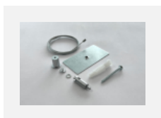
145-50304, N lankový závěs na spoj 4000mm-1 ks + kovový úchyt