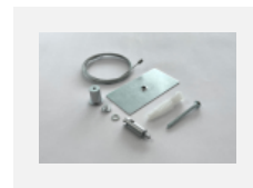
145-50303, N lankový závěs na spoj 2000mm-1 ks + kovový úchyt