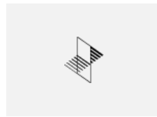
145-20700, S 2 ks úchytu na stěnu Lina45