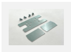
145-50200, F spoj přímý a krytky průsvitu