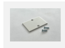
145-50101, S 2xkoncovka - kov, šroubová