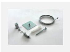
145-50300, N lankový závěs 2000mm-1 ks + kovový úchyt