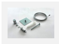
145-50301, N lankový závěs 4000mm-1 ks + kovový úchyt