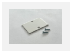
145-50101, S 2xkoncovka - kov, šroubová