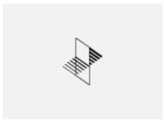
145-20700, S 2 ks úchytu na stěnu Lina45