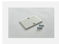
145-50101, B 2xkoncovka - kov, šroubová