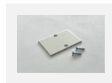
145-50101, W 2xkoncovka - kov, šroubová