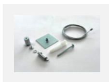
145-50301, N lankový závěs 4000mm-1 ks + kovový úchyt