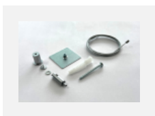
145-50300, N lankový závěs 2000mm-1 ks + kovový úchyt