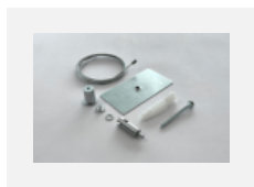
145-50304, N lankový závěs na spoj 4000mm-1 ks + kovový úchyt