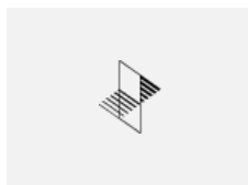
145-01200, F příslušenství k demontáži el. modulu z profilu Liny145