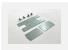
145-50200, F spoj přímý a krytky průsvitu