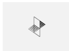
145-20700, W 2 ks úchytu na stěnu Lina45