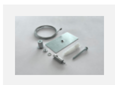
145-50304, N lankový závěs na spoj 4000mm-1 ks + kovový úchyt