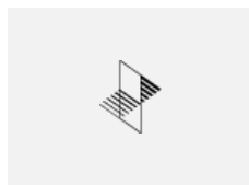
145-20700, S 2 ks úchytu na stěnu Lina45