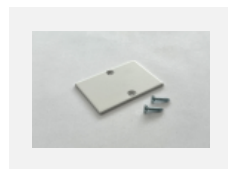
145-50101, S 2xkoncovka - kov, šroubová