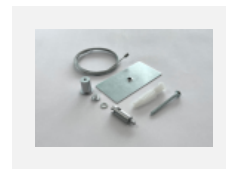
145-50303, N lankový závěs na spoj 2000mm-1 ks + kovový úchyt