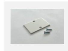
145-50101, S 2xkoncovka - kov, šroubová