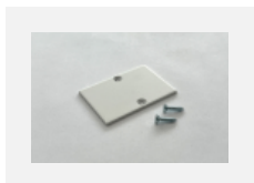
145-50101, W 2xkoncovka - kov, šroubová