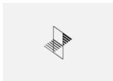
145-20700, W 2 ks úchytu na stěnu Lina45