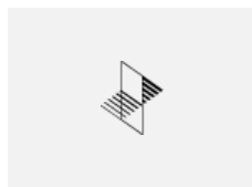
145-20700, W 2 ks úchytu na stěnu Lina45