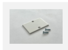
145-50101, W 2xkoncovka - kov, šroubová