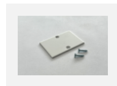
145-50101, B 2xkoncovka - kov, šroubová