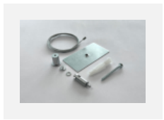
145-50305, N lankový závěs na spoj 6000mm-1 ks + kovový úchyt