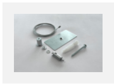
145-50305, N lankový závěs na spoj 6000mm-1 ks + kovový úchyt