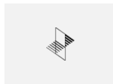
145-20700, S 2 ks úchytu na stěnu Lina45