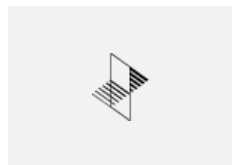
145-20700, S 2 ks úchytů na stěnu Lina45