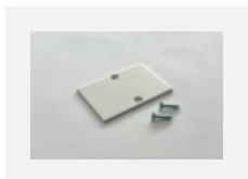
145-50101, S 2xkoncovka - kov, šroubová