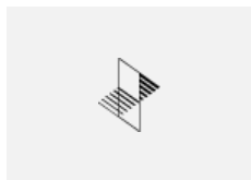
145-20700, S 2 ks úchytu na stěnu Lina45