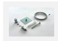
145-50302, N lankový závěs 6000mm-1 ks + kovový úchyt