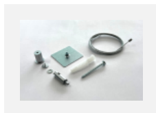
145-50300, N lankový závěs 2000mm-1 ks + kovový úchyt