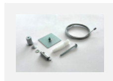
145-50302, N lankový závěs 6000mm-1 ks + kovový úchyt