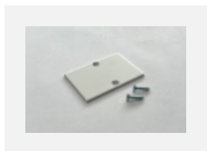
145-50101, S 2xkoncovka - kov, šroubová