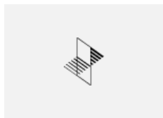
145-20700, S 2 ks úchytů na stěnu Lina45