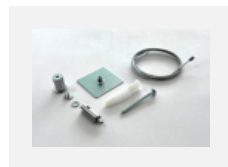
145-50302, N lankový závěs 6000mm-1 ks + kovový úchyt