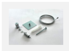
145-50300, N lankový závěs 2000mm-1 ks + kovový úchyt