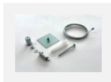
145-50301, N lankový závěs 4000mm-1 ks + kovový úchyt