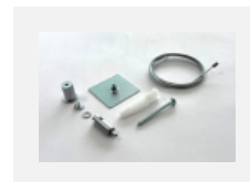
145-50302, N lankový závěs 6000mm-1 ks + kovový úchyt