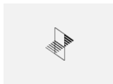
145-20700, S 2 ks úchytu na stěnu Lina45