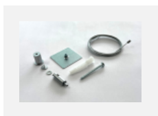
145-50300, N lankový závěs 2000mm-1 ks + kovový úchyt