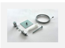
145-50301, N lankový závěs 4000mm-1 ks + kovový úchyt