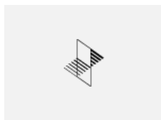
145-01200, F příslušenství k demontáži el. modulu z profilu Liny145