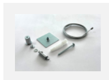
145-50301, N lankový závěs 4000mm-1 ks + kovový úchyt