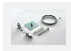
145-50302, N lankový závěs 6000mm-1 ks + kovový úchyt