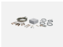
00-00333, W sada pro zavěšení 2000mm, lanka 4ks, kabel 5x0,75mm, kalíšek