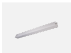
132-51100, K difuzor 2295 mm