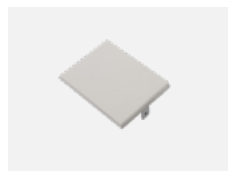
132-50100, W koncovka