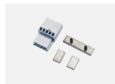
132-50200, F spoj přímý