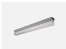
132-50031, W tubus závěsný 1000 mm