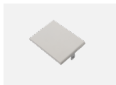
132-50100, S koncovka