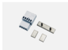
132-50200, F spoj přímý