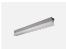
132-50031, S tubus závěsný 1000 mm