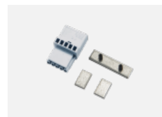
132-50200, F spoj přímý