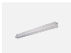
132-51100, K difuzor 2295 mm