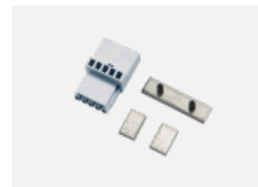
132-50200, F spoj přímý