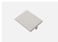
132-50100, S koncovka