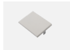
132-50100, S koncovka