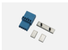
132-50201, F spoj přímý (pro stmívatelná sv.)