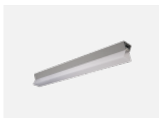
132-50031, S tubus závěsný 1000 mm