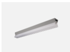
132-50031, S tubus závěsný 1000 mm