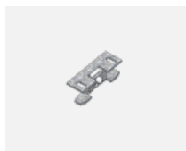
00-00600, F stropní úchyt pro svítidla 132-5xxK, 04-2000x, 05-2000x, 09-