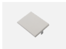
132-50100, S koncovka