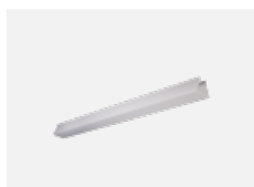
132-51100, K difuzor 2295 mm