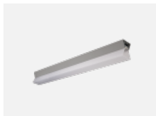
132-50031, W tubus závěsný 1000 mm