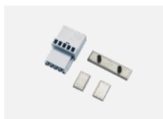
132-50200, F spoj přímý