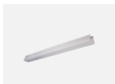
132-51100, K difuzor 2295 mm