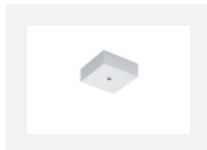
00-00370, W kališek stropní 80x80x32mm