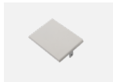
132-50100, W koncovka