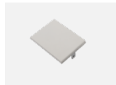
132-50100, W koncovka